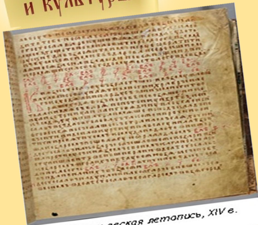
Лаврентьевская летопись, XIV в.

Сплошное письмо было характерно и для письменности других народов как естественный этап её развития. Постоянным употреблением пробела в славянских текстах стало только в XVII веке.